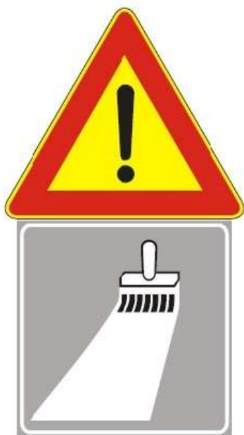
Figura II 391 Art. 31