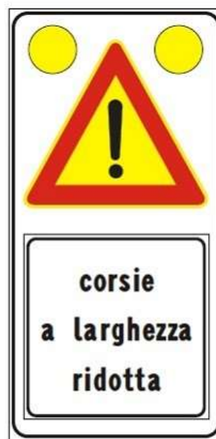
Figura II 391c Art. 31